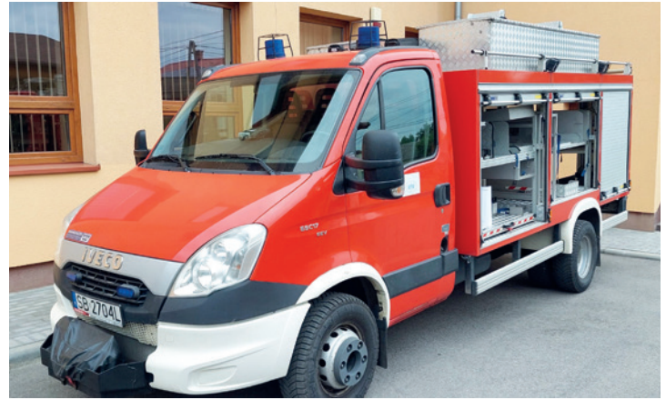
Samochód bojowy IVECO