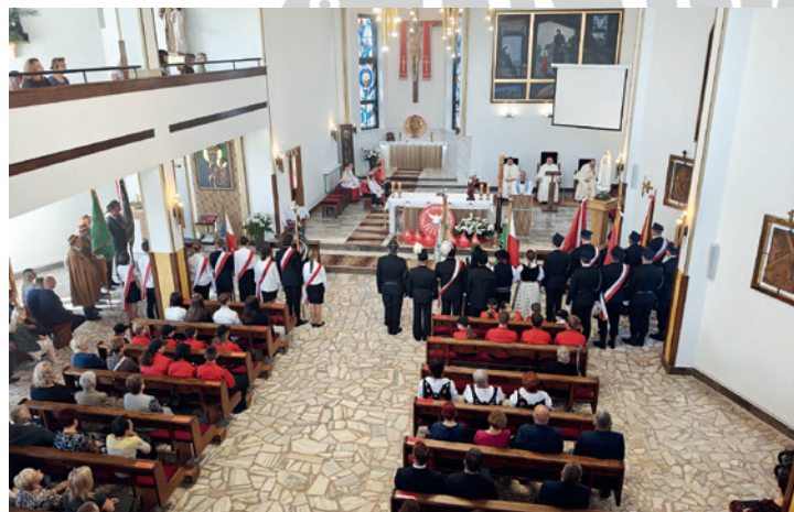
Msza św. w kościele św. Józefa Robotnika