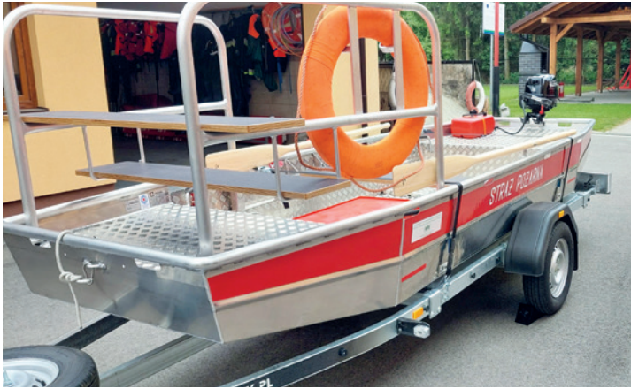
Nowa łódź ratownicza w OSP Kaniów