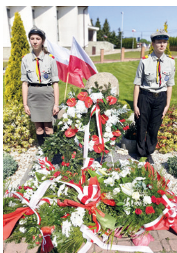
Pomnik na cmentarzu w Janowicach