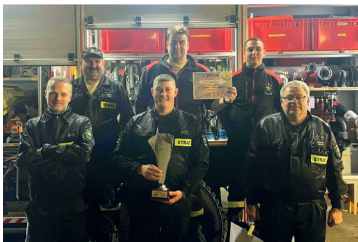
Drużyna OSP Kaniów

Powodów do dumy dostarczyły mieszkańcom gminy Bestwina nasze strażackie drużyny reprezentujące swoje jednostki na różnego typu manewrach i zawodach, jakie były rozgrywane 26 kwietnia.