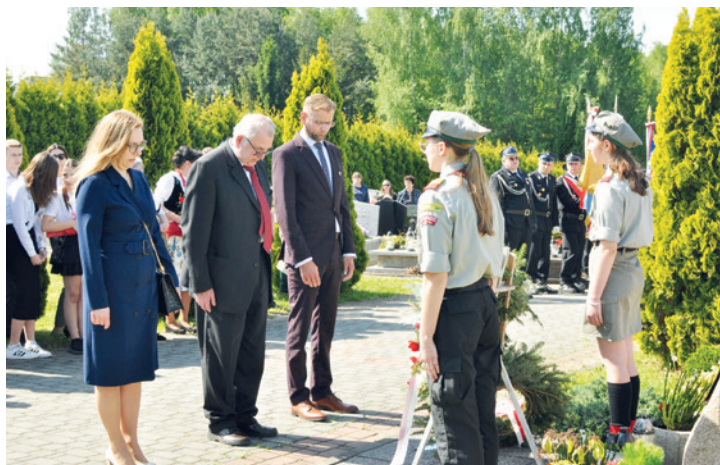
Delegacje składają kwiaty i wieńce