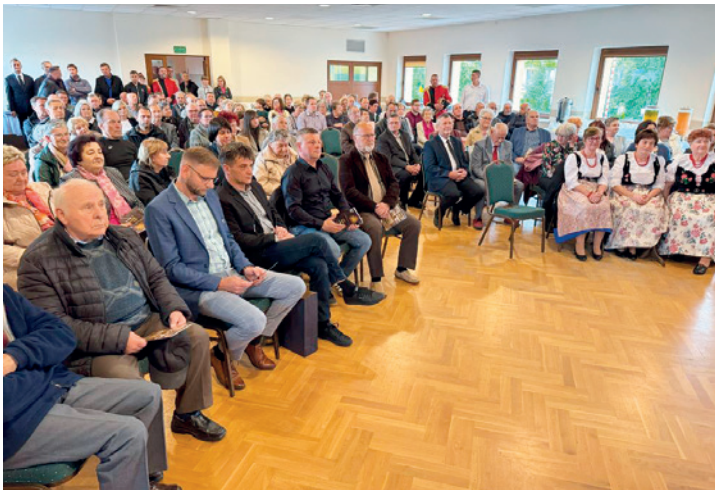
Goście uroczystego otwarcia

Po części oficjalnej na gości czekały regionalne przysmaki. Uczestnicy mieli ponadto okazję zwiedzać Izbę Regionalną, wpisywać się do Księgi Pamiątkowej. Atmosfera była pełna radości, wzruszeń i sentymentu – towarzyszyły jej rozmowy o dawnych czasach, wspomnienia i śpiewy pieśni regionalnych. Wiele osób zatrzymywało się przy eksponatach, opowiadając młodszym pokoleniom o tradycjach przekazywanych z dziada pradiada.