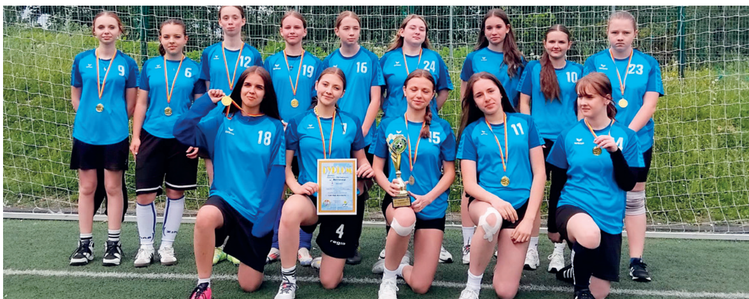
Drużyna dziewcząt ZSP Bestwina

W dniu 6 maja dziewczęta ze szkoły podstawowej w Bestwinie z klas 7-8 reprezentowały placówkę w Szkolnych Mistrzostwach Powiatu Igrzysk Młodzieży w piłce nożnej. Po wielu emocjach i sportowej walce zawodniczki zdobyły I miejsce, tym samym awansując na etap rejonowy do Miłówki. W tym samym dniu odbyły się również rozgrywki na tym samym etapie w kategorii dzieci z klas 4-6 i tutaj również zawodniczki przyjechały z medalami, tym razem z brązowymi.