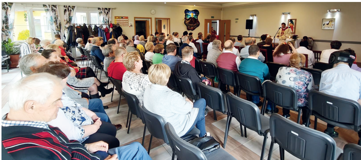
Msza św. w Ośrodku Mieszkalno-Rehabilitacyjnym

Łatwo jest pomagać na odległość, przesłać środki na jakiś szlachetny cel w innym kraju, trudniej przychodzi nam rozejrzeć się wokół siebie.