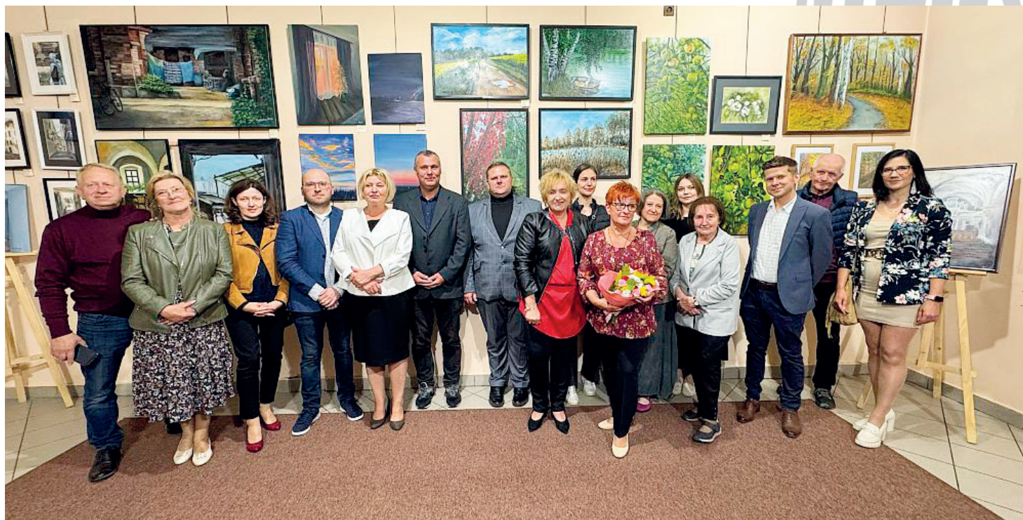
Spotkanie artystów w ramach Nocy Muzeów

W piątkowy wieczór, 16 maja, Muzeum Regionalne im. ks. Zygmunta Bubaka w Bestwinie włączyło się w ogólnopolskie święto kultury, zapraszając mieszkańców i gości na niezwykłą Noc Muzeów . Wydarzenie rozpoczęło się wernisażem Grupy Plastyków „Jaskółka”, a następnie uczestnicy mieli okazję odkrywać muzealne skarby w tajemniczej, nocnej aurze.