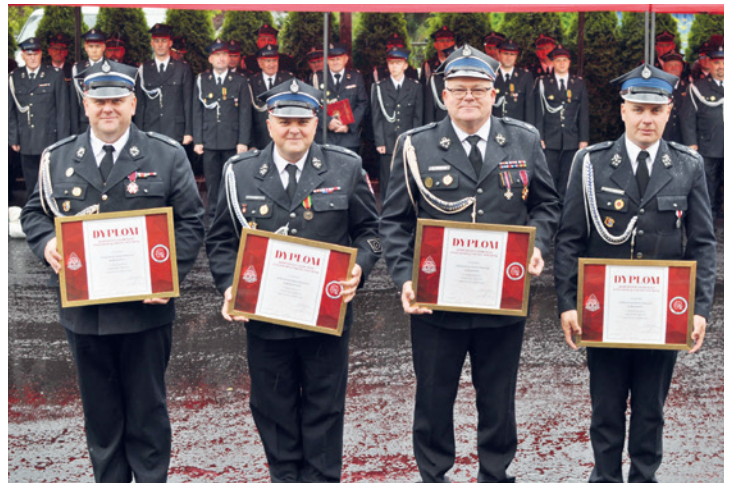
Prezisi jednostek z listami gratulacyjnymi