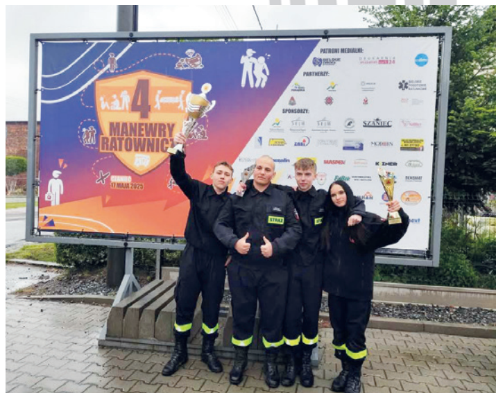
Ekipa MDP Bestwina

- Szkoły Podstawowej w Kaniowie. Największą ilość punktów osiągnęła drużyna ze Szkoły Podstawowej im. Zbigniewa Pietrzykowskiego w Bestwinie zapewniając sobie tym samym promocję do etapu powiatowego, który odbył się w dniu 15 maja br. w Szkole Podstawowej im. Jana Pawła II w Pisarzowicach. Wszystkie drużyny otrzymały nagrody i upominki ufundowane przez Wójta Gminy Bestwina Grzegorza Bobonia .