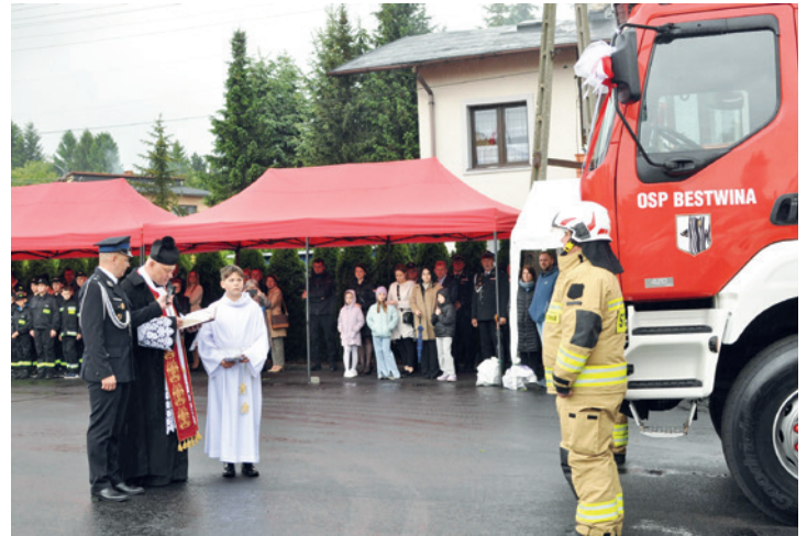
Poświęcenie wozu bojowego Kerax