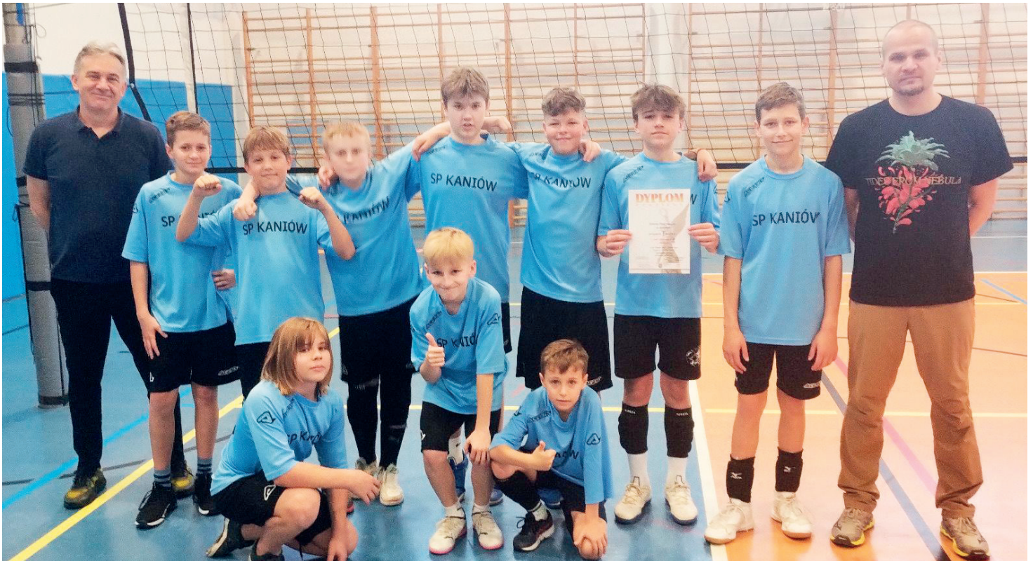
Siatkarze z ZSP Kaniów

SP ZCBM - Bielsko Biała - SP Radziechowy 2:1