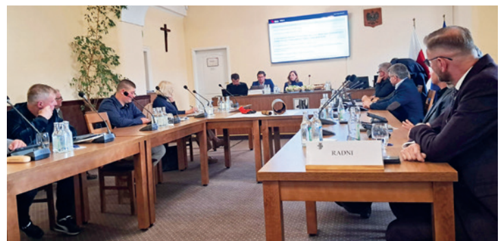
Radni słuchają wystąpienia prezesa Kombestu

W odpowiedzi na zaistniałą sytuację, Kombest podjął działania doraźne, takie jak systematyczne (cotygodniowe) płukanie sieci wodociągowej w tych rejonach oraz wprowadzenie zmian w systemie uzdatniania wody. Równoległe trwają prace planistyczne nad długofalowymi inwestycjami, które zakładają wymianę przestarzałej infrastruktury – jednak realizacja tych projektów uzależniona jest od możliwości pozyskania i zabezpieczenia środków finansowych.