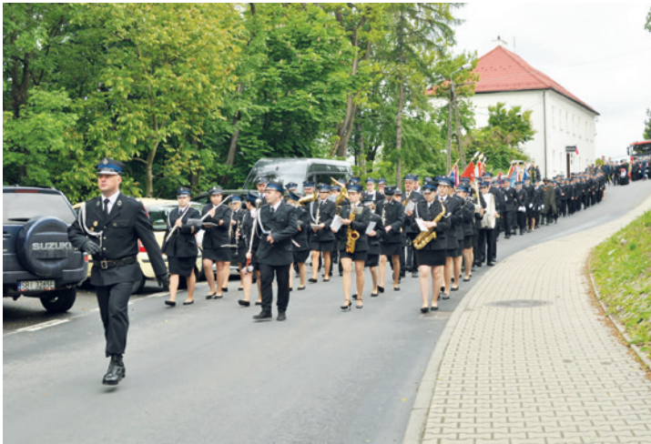
Uroczysty pochód z kościoła do strażnicy

cząca KGW Bestwina, członkowie honorowi, reprezentanci kół i stowarzyszeń z gminy Bestwina, przedsiębiorcy – dobroczyńcy OSP Bestwina, przyjaciele i reprezentanci zaprzyjaźnionych jednostek z gminy Bestwina, z Dankowic, Jawiszowca, Kobiernic, Lipowca, Międzybrodzia Bialskiego, Pisarzowic, Starej Wsi i Wilamowic.