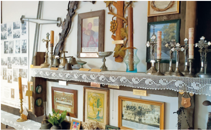
Wyposażenie izby - ekspozycja sakralna